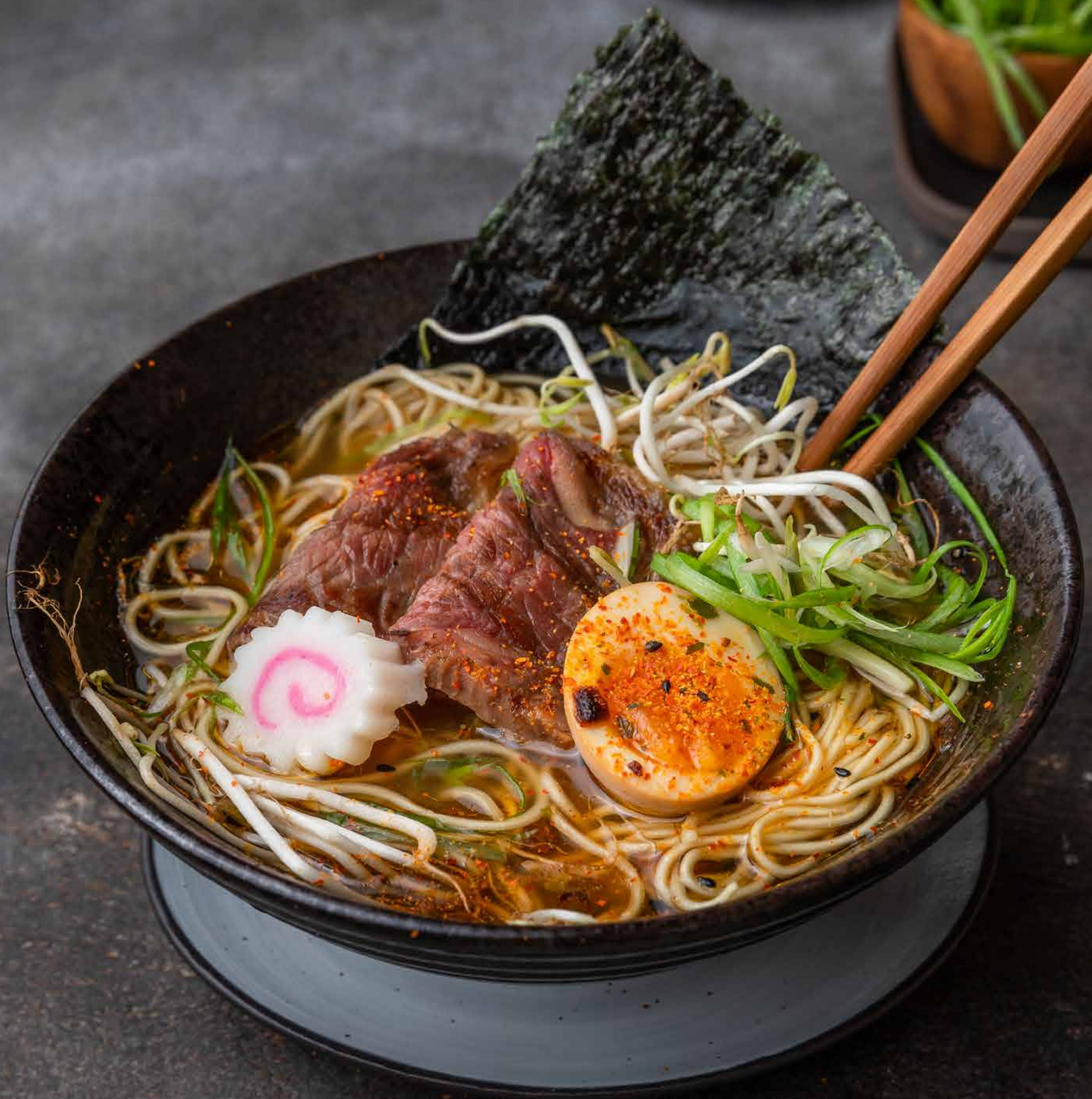
classic shoyu ramen